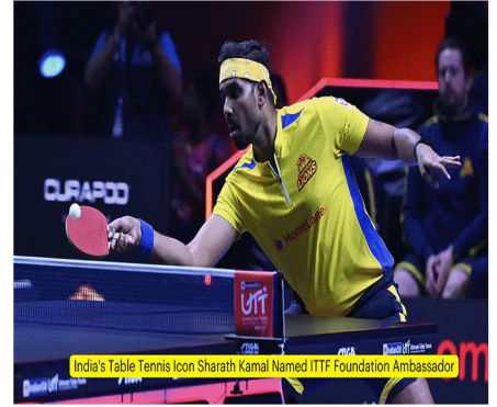
India's Table Tennis Icon Sharath Kamal Named ITTF Foundation Ambassador